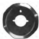
Kuris / Maimin Suprena