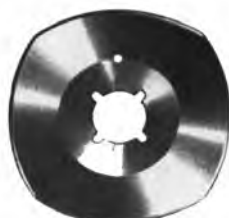
Kuris / Suprena