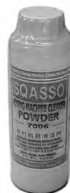
A1133 polvere detergente per piastre termoadesive e ferri da stiro