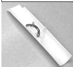
R991186 canalina Rimoldi