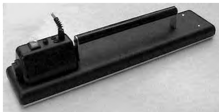
A3500 Piastra per termoadesivi termostato regolabile 75x15 1600W 220V.