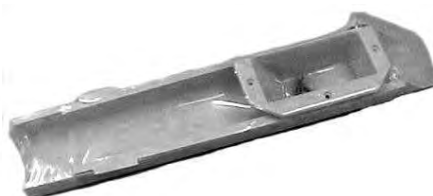
MS205468-69-70 (=KX10-12-13) canalina W&G = Siruba/Mauser