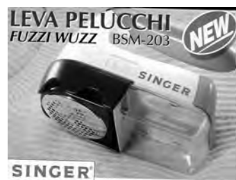
A1058 levapelucchi a batteria