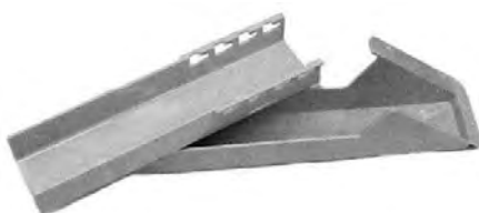
J118-50054 canalina Juki