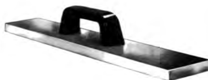
Pesi fermatessuto A1060 Kg.1 A1061 Kg.1,700 A1062 Kg.3,400 A1063 Kg.7